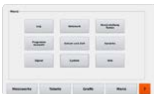
Aperçu des menus

De surcroît, un signal acoustique aide l'utilisateur à contrôler la stabilité et le niveau du réservoir d'eau.