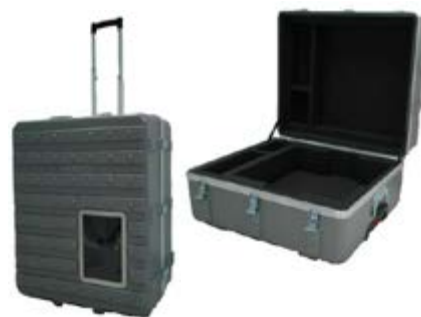
Malette de Transport